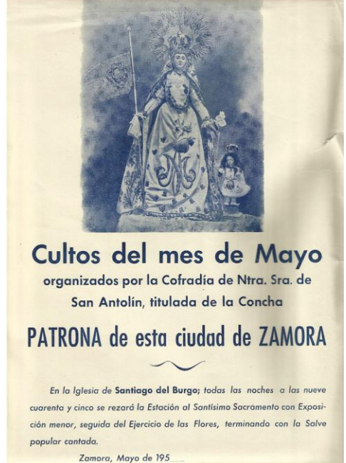
Cartel del ejercicio de las flores.